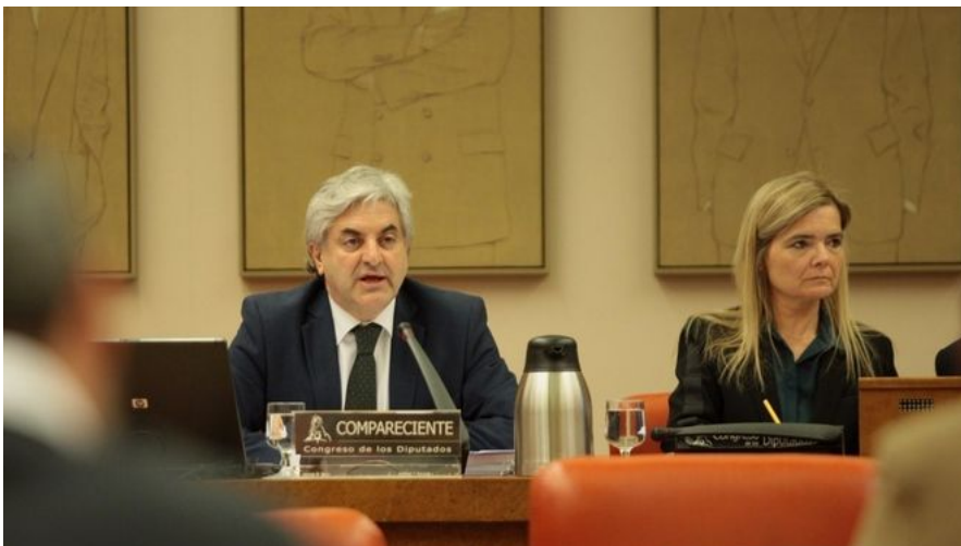
Los graduados sociales piden "educar a los trabajadores" para que ahorren y mejoren sus pensiones MADRID | EUROPA PRESS